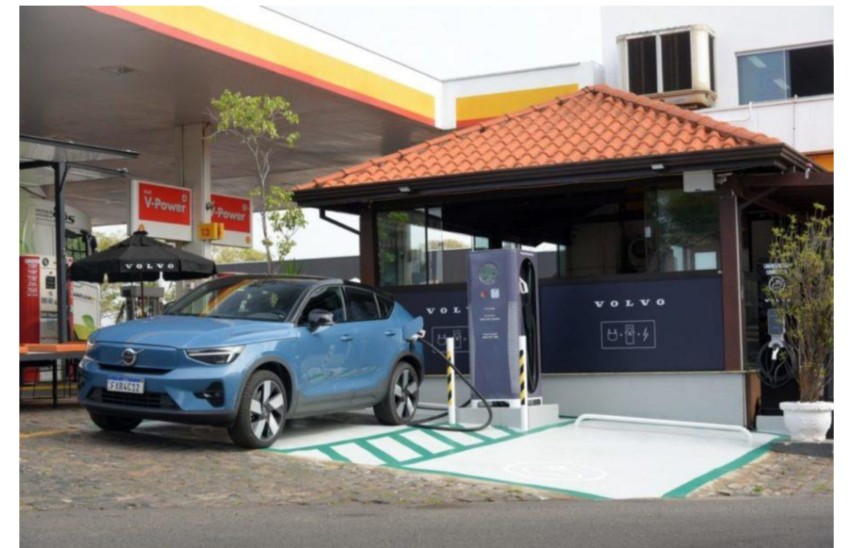
Figura 1: https://motorshow.com.br/volvo-investe-em-nova-expansao-de-eletpostos-pelo-brasil/

A transição para veículos elétricos e híbridos no Brasil é um movimento que está ganhando força, mas ainda encontra muitos desafios. O setor automotivo nacional, historicamente dependente de combustíveis fósseis, enfrenta o desafio de se adaptar a uma nova realidade tecnológica e ambiental. Ao mesmo tempo, o país busca maneiras de equilibrar essa transição com seu desenvolvimento econômico e social. A partir disso, surgem questões que vão desde a falta de infraestrutura adequada até resistências culturais e econômicas.